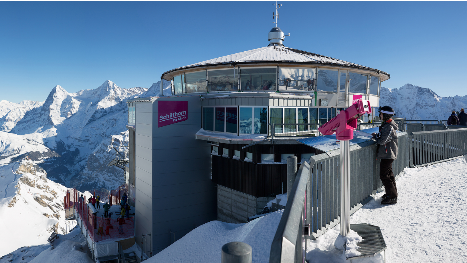
Le bâtiment du sommet Schilthorn - Piz Gloria en hiver